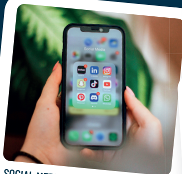
SOCIAL MEDIA MARKETING STRATEGIES